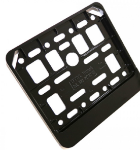
Ramka tablicy rejestracyjnej motocyklowa.