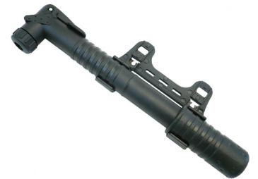
Pompka rowerowa wym. 22x400 mm (plastikowa)