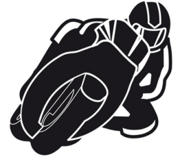
Naklejka na motor wzór motocyklista