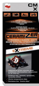
Dodatek do regeneracji silników motocyklowych czterosuwowych z mokrym sprzęgłem. Wersja Extreme.