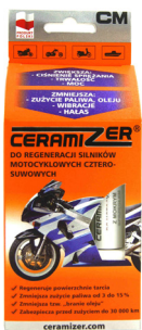
Dodatek do regeneracji silników motocyklowych czterosuwowych z mokrym sprzęgłem.