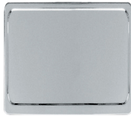
Podkładka pod tablice rejestracyjne. Rozmiar 140x110 cm.