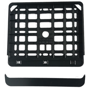
Ramka tablicy rejestracyjnej motorowerowa.