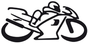
Naklejka na motor wzór motocyklista