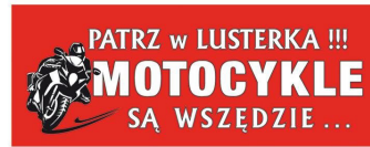
Naklejka na motor - motocykle są wszędzie, kolor czerwony