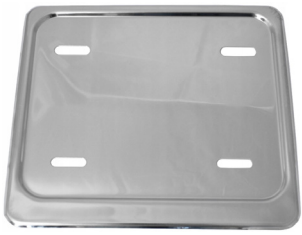
Podkładka pod tablice rejestracyjne. Rozmiar 190x140 cm.